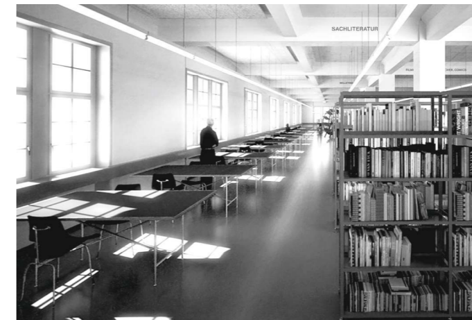
Visualisierung Bibliothek (Barão-Hutter GmbH)