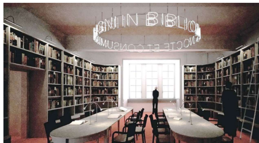
Visualisierung Turmzimmer (Barão-Hutter GmbH)

2011-2013 Wiederaufbau Sporthalle GBS Demuttal St. Gallen