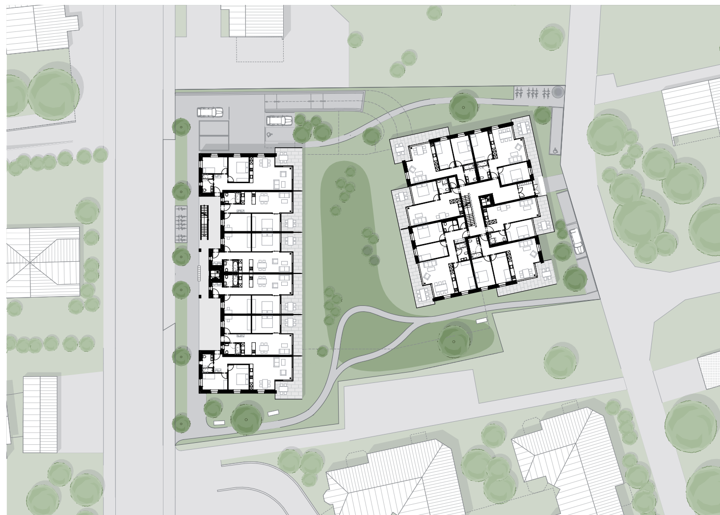
Umgebungsplan mit Erdgeschoss