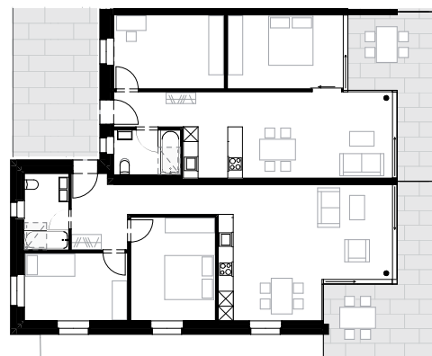
Wohnungstypen Haus A